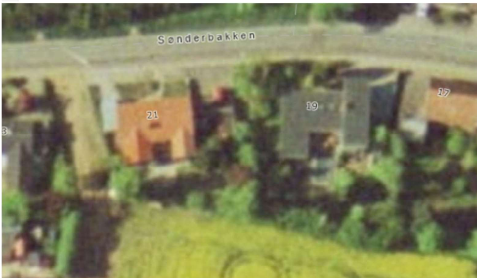
Luftfoto 1999 – rødt tag – nu er der to "knotter" på huset mod syd